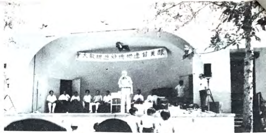
柏旋理事長，在郊遊會上作會務講話。