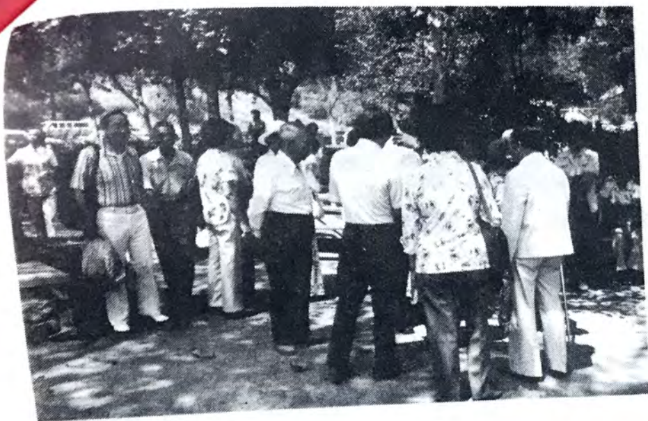
年年有春宴，歲歲有郊遊，歡樂到人間，共享半日閒。——這是參加本會春宴、郊遊節目的圖片：