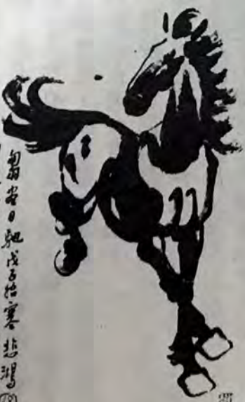
勿謂言。此成古語。悲理。周汝健。某日。用馬。寫。

就某方面而言，美國的命運繫於能源問題的出路。我堅信通過齊心協力合作，美國人民能夠綽有餘地解決這個問題，而問題的解決有賴於新發掘的能源資源，良好的判斷力和運氣。