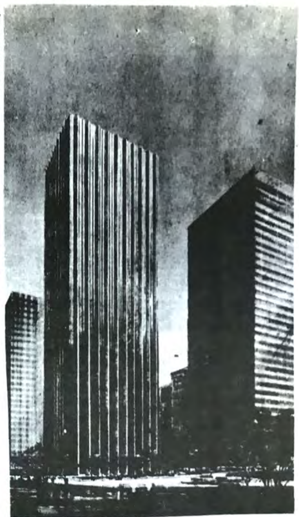
華裔劃則師黃振捷設計之新摩天大廈