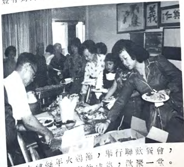
會堂聚餐，歡聚聯歡，舉行集會，節助老，火者，年加，每參，曾為，本圖。

上學期考試的成績，還可以過得去，在這里，我把上學年的家庭報告表寄上，給你老人家看看，如今，各門課目的學習還較適應，過去英語基礎差，來到大學以後，只好從頭學起，經過一學期的努力，才學了拼音和一些簡單的句型，同「四化」的要求差得很遠，我要立下志願加倍學習，才能游到光輝的彼岸。 好了，今次就談到這里吧，由于我不會寫繁體字，只能用簡體字寫出，有勞你老人家費神閱讀，對不起，請原諒。 祝你