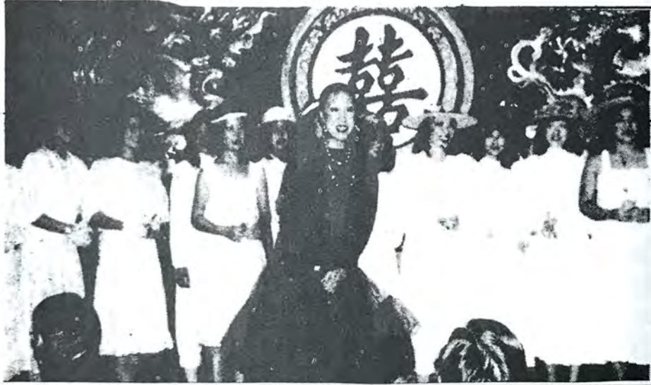
參加羅省甘邊同鄉會春宴舉行時裝表演之全體模特兒由黃秀蓮領衆出場與嘉賓相見。