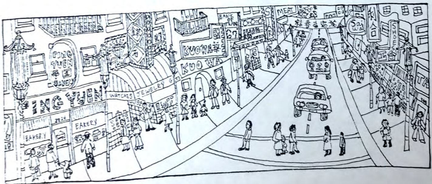
Sunday in Chinatown

Children are invited to color in the drawings.