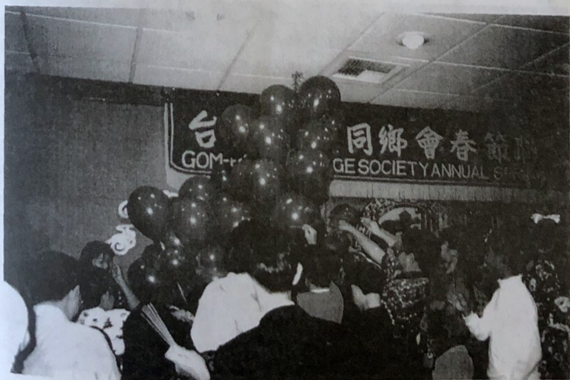
健和夫人及沛林主持之遊慶節目《燒炮仗》熱鬧一瞥