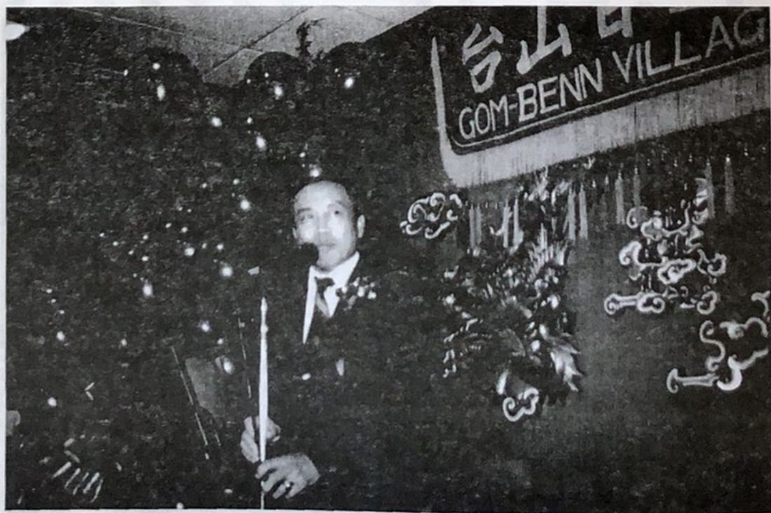
本會主席致新春賀詞