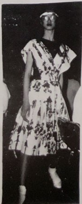
Strength AND Determination