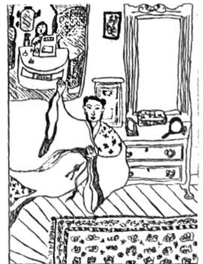
Being An Asian American