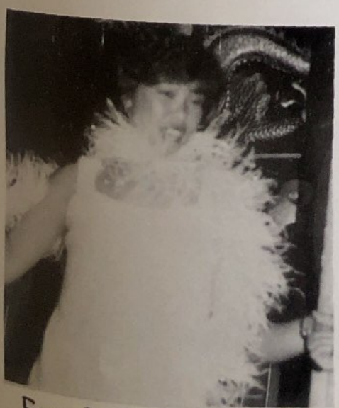
Ever So Fashionable