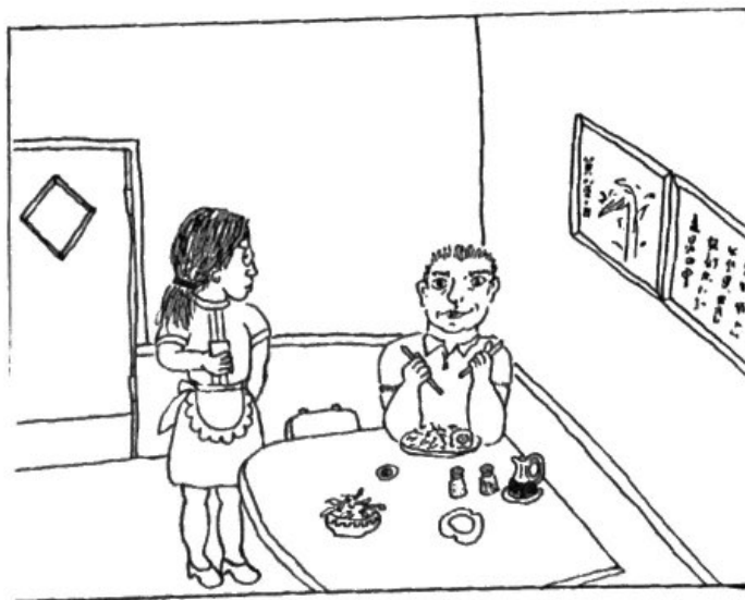
Working In Her Parent's Restaurant