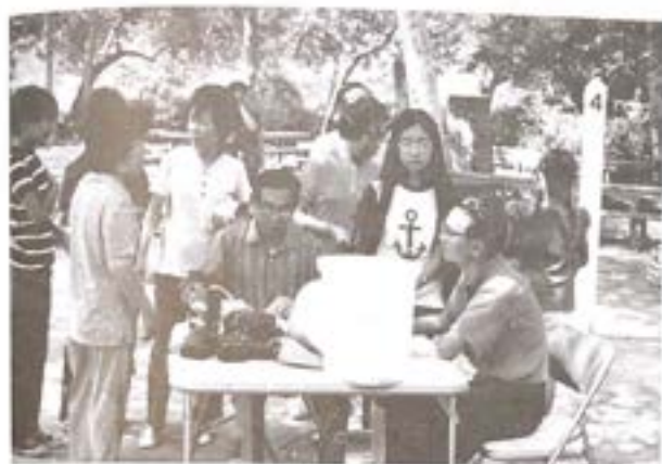
1970年本會第一次郊遊會中 請白叫大家來簽名