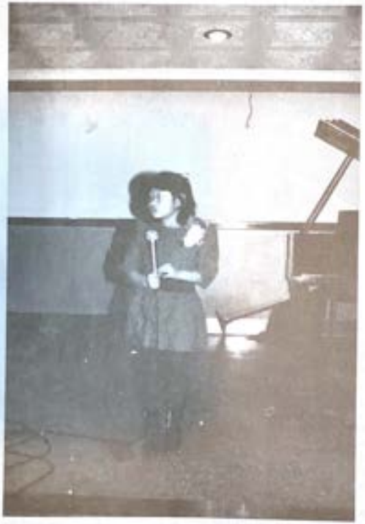
十週年紀念唱八音盒歌