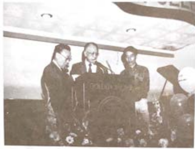
顏向植禮節連碩慶朱子文慶會堂