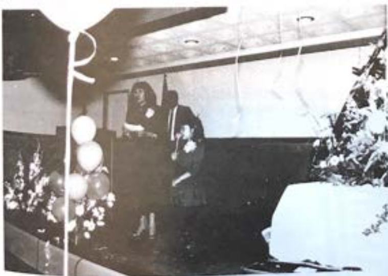
于倫與她母親合唱會慶歌