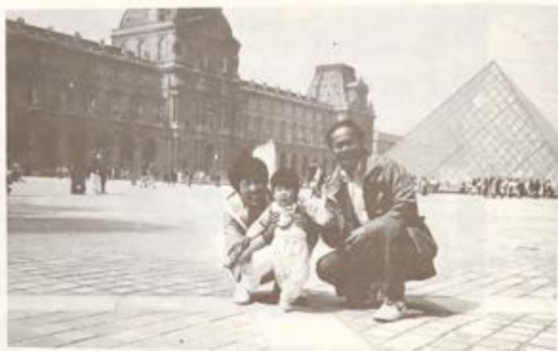
華裔建築大師貝聿銘先生設計的巴黎 羅浮宮博物館之玻璃金字塔