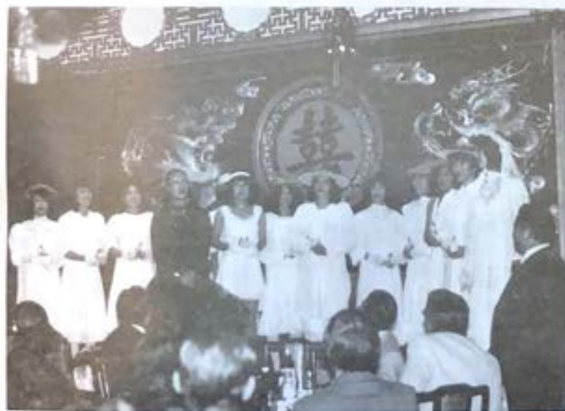
本會春宴首次時裝表演