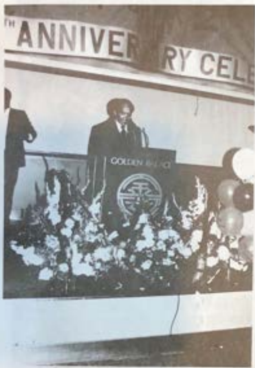
建祥顧問致答謝詞