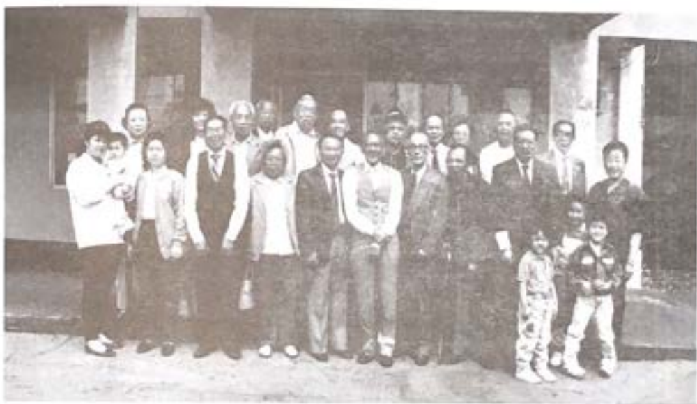
紀念日在會所攝影