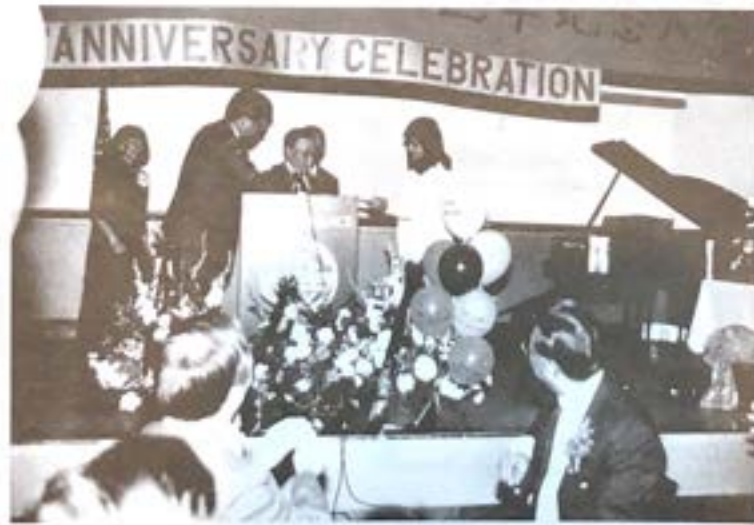
顏向植禮節連碩慶朱子文慶會堂