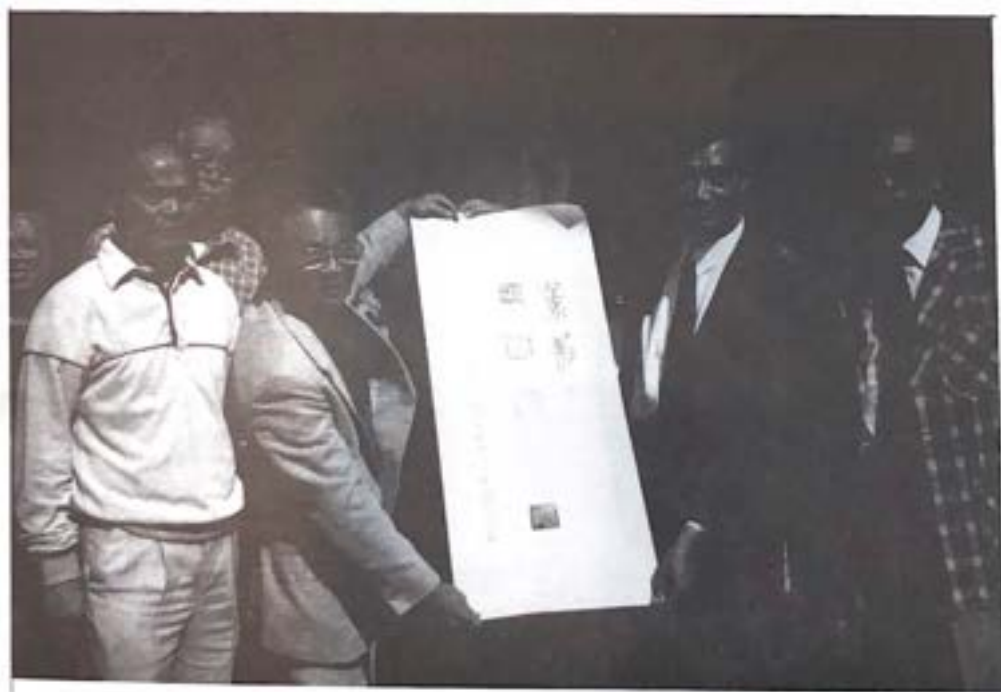
江門市赴美加聯誼代表團與錫柱主席等留影。