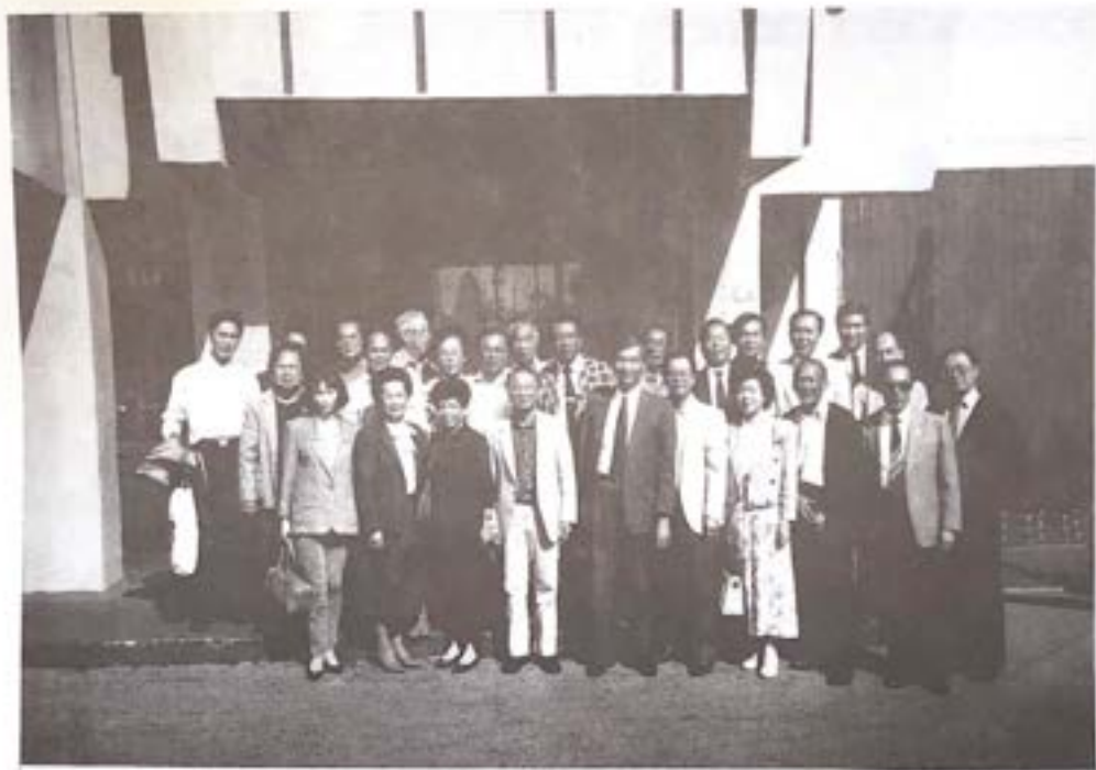
台山縣教育電視台代表團訪美，與本會同人留影。